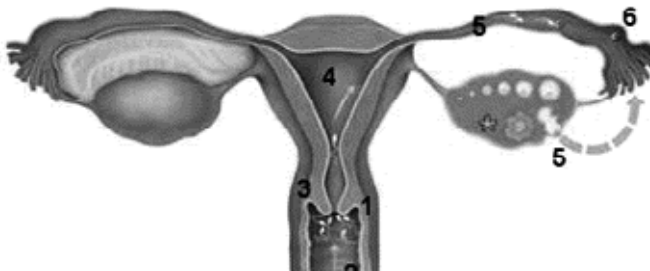
Figuur 1: Zaadcellen (1) via de vagina (2), baarmoedermond (3) en baarmoederholte (4) komen in de eileider (5) terecht en kunnen daar de eicel (6), die is vrijgekomen uit de eierstok, bevruchten

Intra-uteriene inseminatie (IUI) is het inbrengen (insemineren) van zaadcellen direct in de baarmoeder (intra-uterien). In de normale situatie komt na een zaadlozing in de vagina het sperma met de zaadcellen in de buurt van de baarmoedermond. Via het slijm van de baarmoedermond komen de zaadcellen via de baarmoederholte in de eileiders, waar de bevruchting van een eicel kan plaatsvinden (figuur 1).