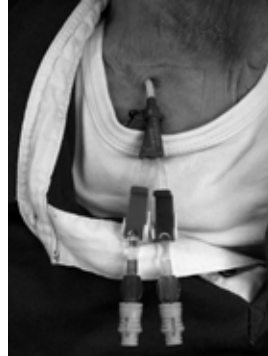
Afbeelding 4: dialysekatheter, dubbellumen (bron Maastricht Ziekenhuis)

Wanneer er eerder of zelfs acuut gestart moet worden met de dialysebehandeling wordt er onder plaatselijke verdoving een dialysekatheter (een kunststof slangetje) ingebracht. Deze katheter wordt in de hals of lies in een groot bloedvat ingebracht en kan direct worden gebruikt. De dialysekatheter is een tijdelijke oplossing. Hij vormt een 'open' verbinding met de bloedbaan en is om die reden infectiegevoelig.