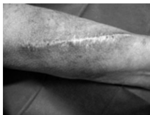
Afbeelding 3: shunt

Een shunt is een kunstmatige verbinding tussen een slagader en een ader. Zo stroomt het bloed van de slagader naar de ader waardoor er in de ader een verhoogde druk ontstaat. Door de verhoogde druk zet de ader op. Hierdoor is het bloedvat makkelijker aan te prikken voor de hemodialyse.