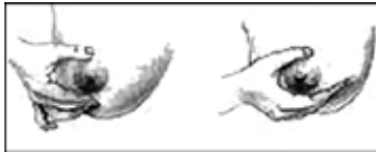
Goed Fout Knijp niet in de borst!