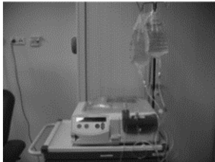
Afbeelding 3: opstelling Home Choice

Bij de CAPD vinden 4 handmatige wisselingen overdag plaats. Bij de APD voert de machine, de Home Choice, na het aansluiten een vooraf bepaald aantal wisselingen voor u uit.