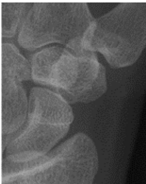
Röntgenfoto van een normaal duimbasis en polsbotgewricht

U bespreekt uw klachtenpatroon met de arts en een lichamelijk onderzoek wordt uitgevoerd. In geval van verdenking op een duimbasis en/of polsbotstijtage wordt een röntgenfoto gemaakt. Soms is aanvullend onderzoek nodig in de vorm van een CT scan.