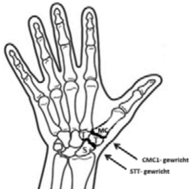
Plaatsen in het duimbasis en/of polsbotgewricht waar slijtage (dikgedrukt) kan optreden

Het versleten handwortelbeentje wordt verwijderd. Een peesstrip van een van de polsbuigers wordt op een bepaalde manier ingevlochten om de duim weer stabiliteit te geven. Aan de palmzijde zullen twee littekens zichtbaar zijn (de stippellijn).