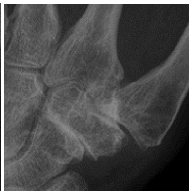
Röntgenfoto waarbij beginnende slijtage en een verzakking van het CMC1 gewricht en slijtgage van het STT gewricht is te zien