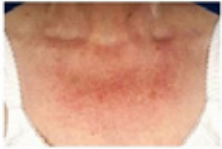
Poikiloderma van Civatte