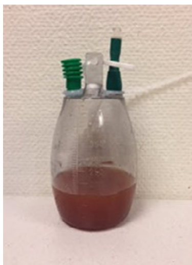
Groene dop staat omhoog (vacuüm = niet goed)