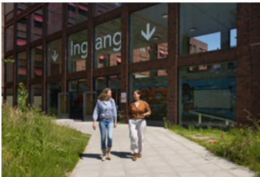
Ingang achterzijde ziekenhuis

Er is een ingang aan de achterzijde van het ziekenhuis. Deze bevindt zich schuin tegenover de parkeergarage. De ingang aan de achterzijde is geopend van 07.00 - 20.00 uur.